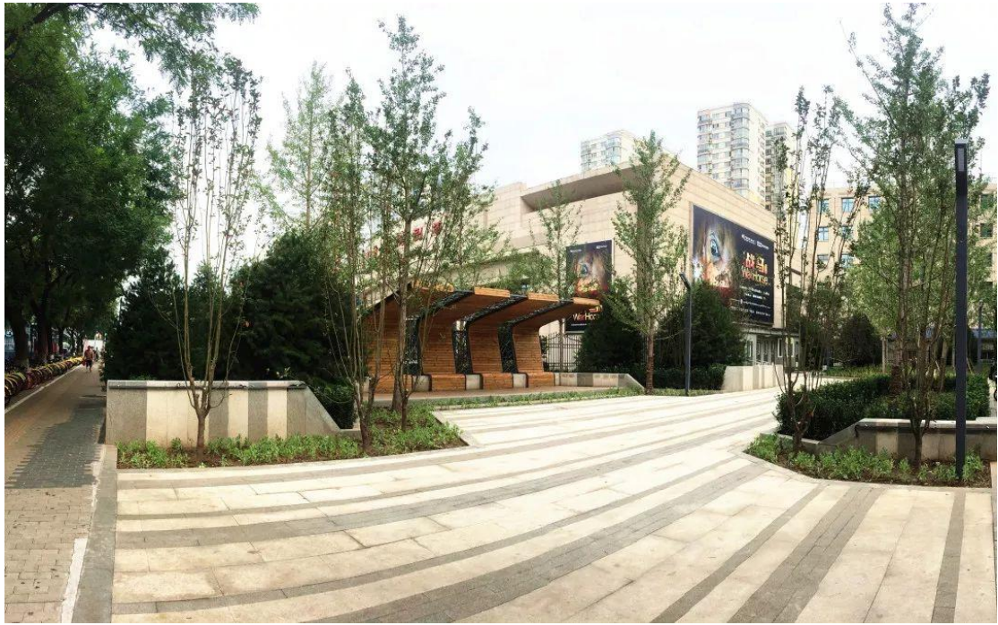
国话东侧口袋公园

绿地多少，衡量着一个地区的宜居指数。今年，地区新增常乐坊、逸清园两处城市森林公园，国家话剧院东侧口袋公园，红居北街、马连道南街等在内的四处小微绿地，面积超过 3 万平方米。