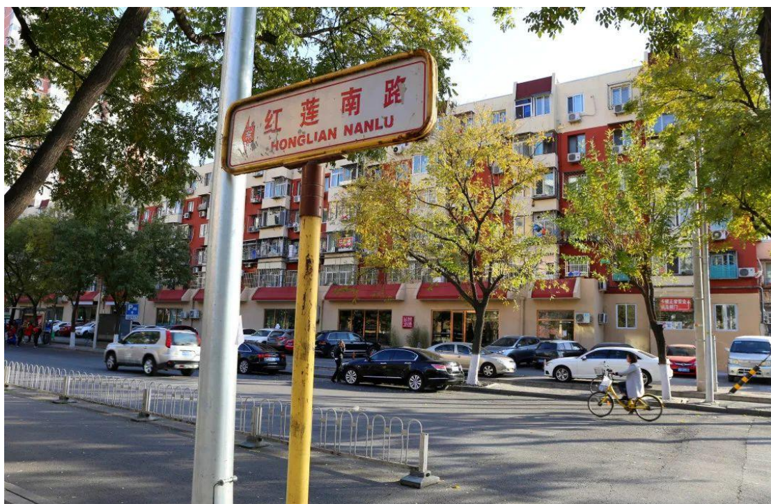
红莲南路西段街景