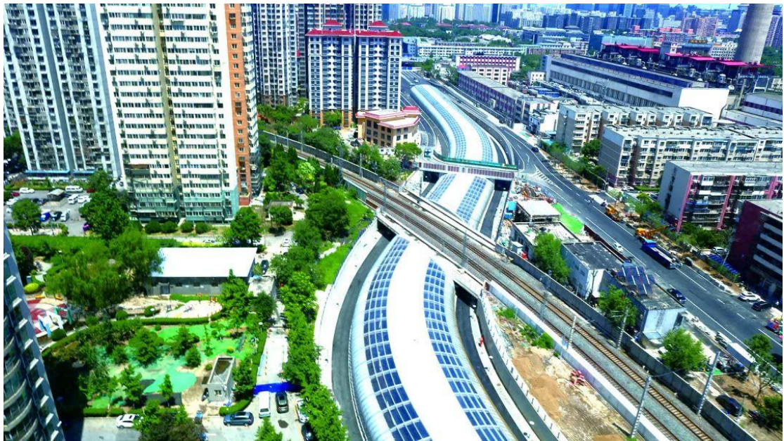
竣工后的手帕口平改立工程

今年，广外在街区畅通上下足功夫，马连道南街半幅路拓宽了，“闹心”了12年的手帕口平改立也通车乐，广外发展不断“提速”。