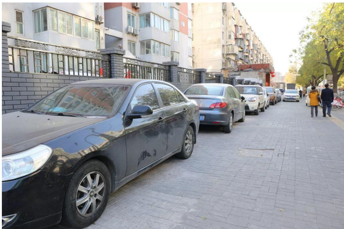
整治后的瑞莲家园小区门前

在前往下一站的路上，大家在大巴车上沿途视察了广外首批达标街巷 茶源路 、拓宽后的 马连道南街 和 马连道北路 ，以及 手帕口平改立工程 等。