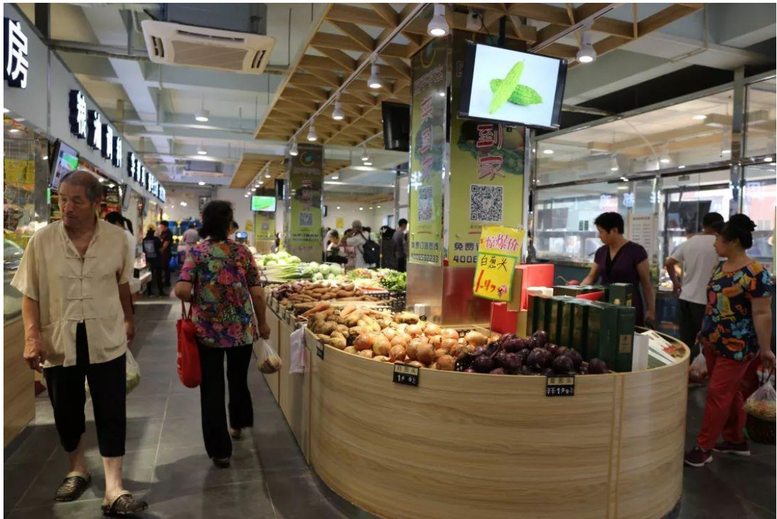
青年湖百姓生活服务中心

今年，广外不断提升老百姓生活便利性，引进了盒马鲜生，打造了青年湖百姓生活服务中心以及依莲轩便民菜店等。同时，不断完善便民服务网点功能，维修、理发、早餐点以及“小物专柜”等让居民乐享便利。